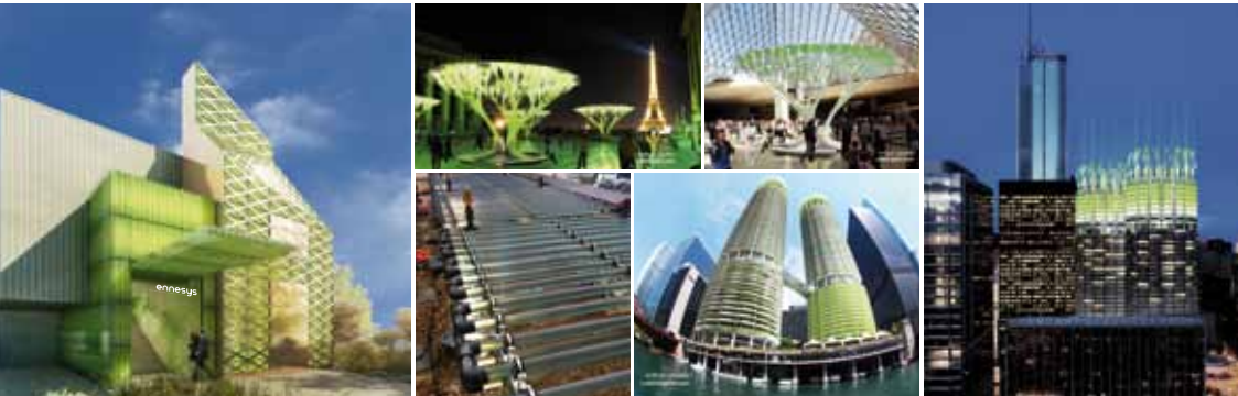
Vue du bâtiment pilote, l'Urbanlab, conçu par les architectes Manuelle Gautrand et Axel Schoener, à La Défense Seine Arche, à Nanterre.

La technologie développée consiste à recycler les eaux usées, le CO 2 et les déchets organiques issus des bâtiments pour nourrir des cultures de phytoplancton (micro-algues) dans des bassins fermés installés en toitures, terrasses ou façades des bâtiments aux fins de produire une biomasse algale transformable in situ en source d'énergies.